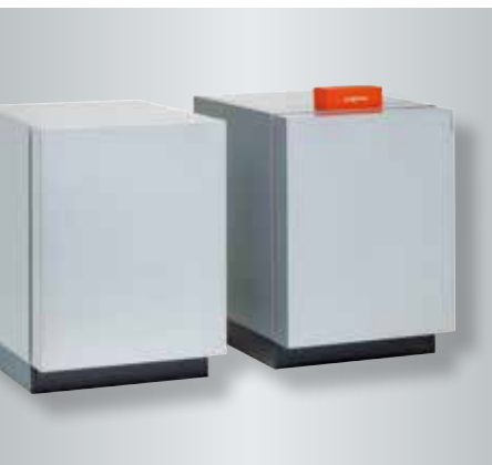
Vitocal 300-G à deux allures en version pompe à chaleur sol/eau ou eau/eau